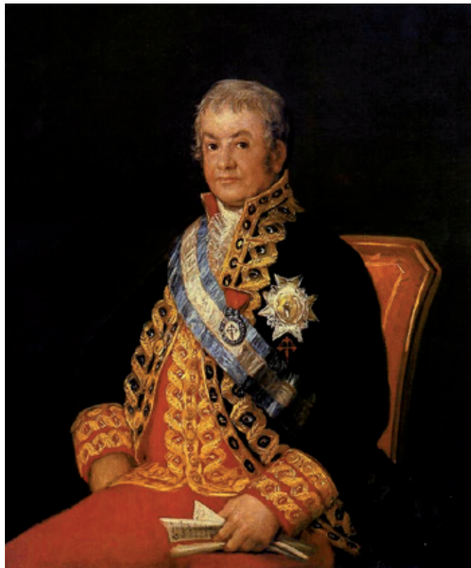
Figura 1. José Antonio Caballero, por Francisco de Goya, 1807. Museo de Bellas Artes de Budapest. https://commons.wikimedia.org/wiki/File:Retrato_de_José_Antonio_Marqués_Caballero.jpg

Como es bien conocido la Real Expedición Anticuaria de México le fue encomendada por Real Orden de 2 de mayo de 1804 al capitán retirado de Dragones, Guillermo Dupaix (1748-1817). Este oficial, que había llegado a Nueva España al comenzar la década de los noventa 2 , había alcanzado en los albores del siglo XIX unos conocimientos respetables de las antigüedades mexicanas, gracias a sus propias pesquisas y exploraciones (López Luján, 2011: 71-81; López Luján y Pérez, 2013: 78-89). Sin duda, estos conocimientos, además de su condición de militar, y el reciente fallecimiento de otros competentes anticuarios novohispanos 3 , le hicieron acreedor de ser honrado con la dirección de la expedición que se pretendía llevar a cabo. Hoy sabemos que fue el decano de la Audiencia de México, Ciriaco González Carvajal (1745-1828) 4 , quien propuso a Dupaix al virrey de España, José de Iturrigaray, para desempeñar este cometido (Estrada de Gerlero 1994b: 193-194; López Luján y Pérez, 2013:79). La propuesta fue remitida a España a finales de 1803 donde obtuvo buena acogida por parte del secretario de Gracia y Justicia, que entonces se ocupaba también de los asuntos de Indias, José Antonio Caballero (1754-